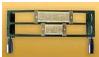
O-FRAME 2L 9

Három soros betűtartó keret egy sor 9 mm-es, és két sor 4 mm-es betűsor részére.