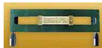
O-FRAME 1L 6

Egy soros betűtartó 5,5 mm-es betűk részére, amely speciálisan az O.GOLDCHANNEL BASE- el (speciális gerincaranyozó készlettel) való együttes alkalmazásra lett kialakítva