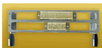
O-FRAME 2L 6

Három soros betűtartó keret 5,5 mm-es betűk részére.