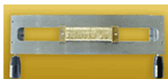
O-FRAME 1L 5,5

Három soros betűtartó 4 mm-es betűk részére.