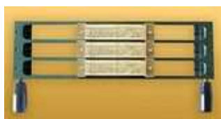
O-FRAME 3L 4

Három soros betűtartó 4 mm-es betűk részére.