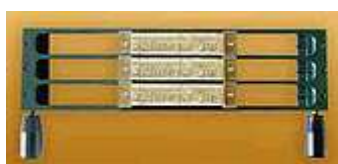
O-FRAME 3L 5,5

Egy soros betűtartó 6 mm-es betűk részére, amely speciálisan az O.GOLDCHANNEL BASE- el (speciális gerincaranyozó készlettel) való együttes alkalmazásra lett kialakítva.